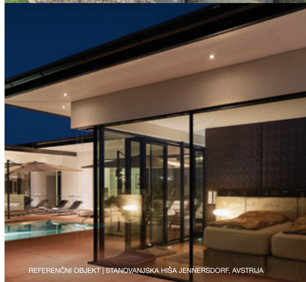
REFERENČNI OBJEKT | STANOVANJSKA HIŠA JENNERSDORF, AVSTRIJA